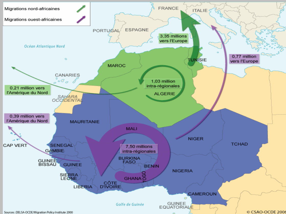
Migrations nord-africaines et ouest-africaines